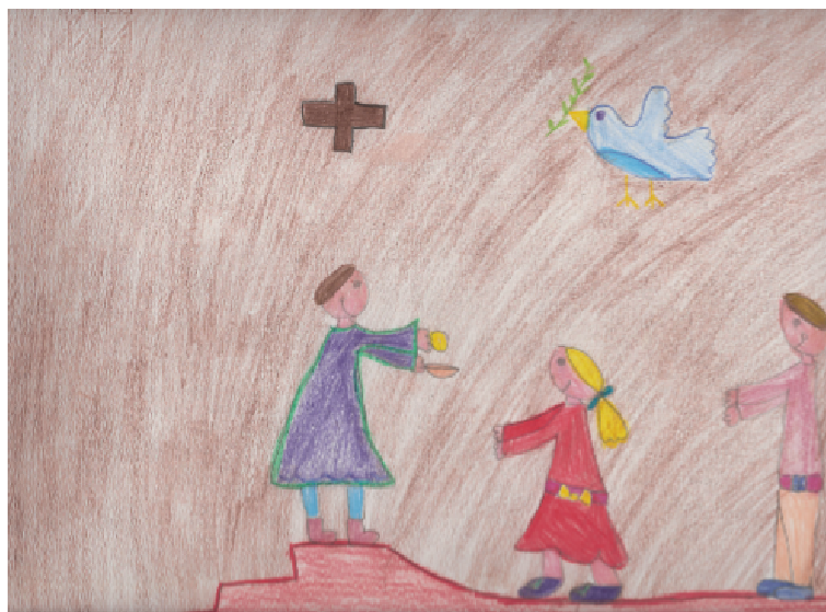
Osanna al Figlio di Davide (Mt.21,9)