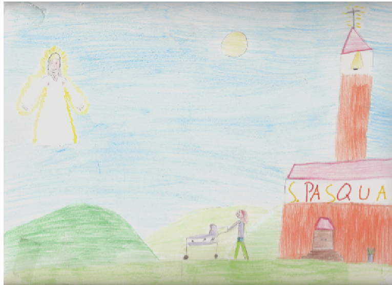
Io sono la risurrezione e la vita (Gv.11,25)