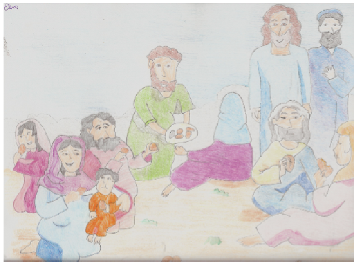
Io sono il pane disceso dal cielo (Gv.6,41)