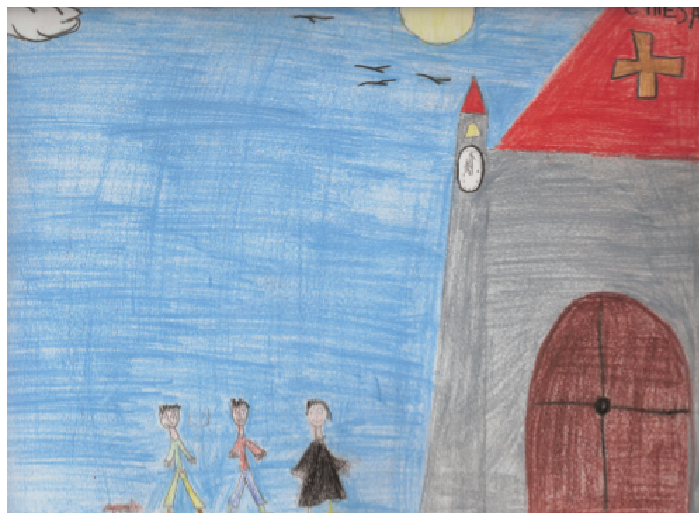
Rivestitevi del Signore Gesù Cristo